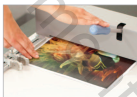
Rainage sans effort même sur les forts grammages

Raineuse manuelle innovante et hautes performances pour un rainage aisé des grands formats.