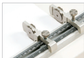
Butées arrières de positionnement